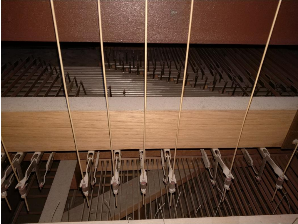
Elementy traktury gry