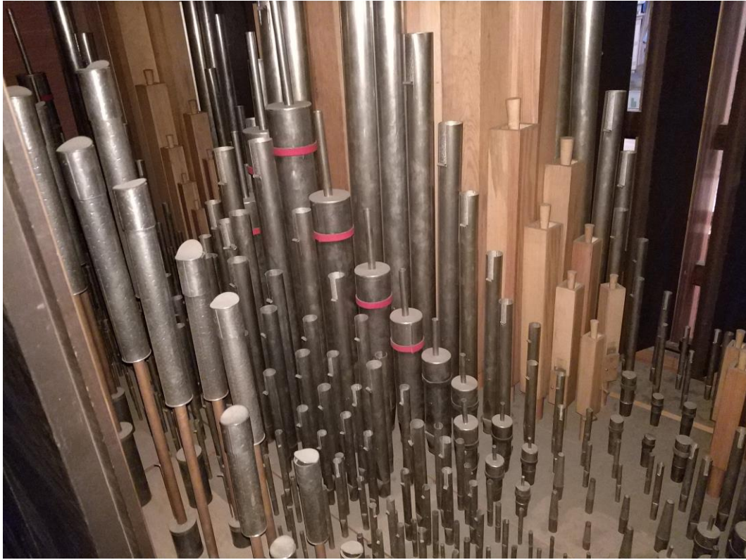
Piszczatki sekcji II manuafu