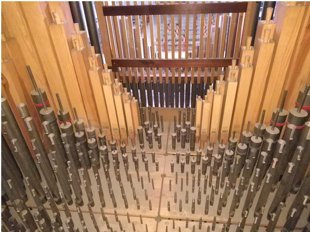
Piszczatki sekcji I manuafu