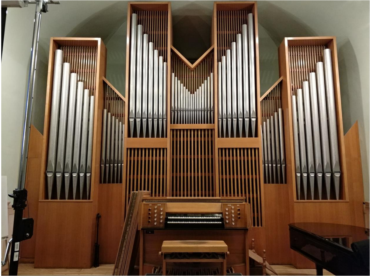
Widok na kontuar oraz prospekt organowy