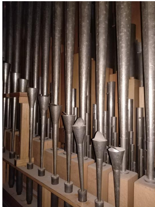
Piszczalki sekcji pedału