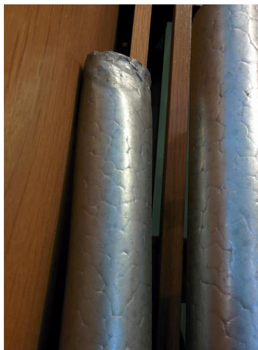
Uszkodzenia w piszczałkach prospektowych