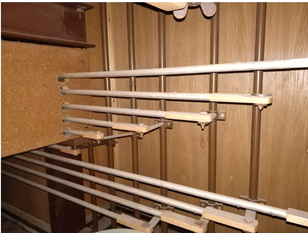
Elementy traktury rejestrowej